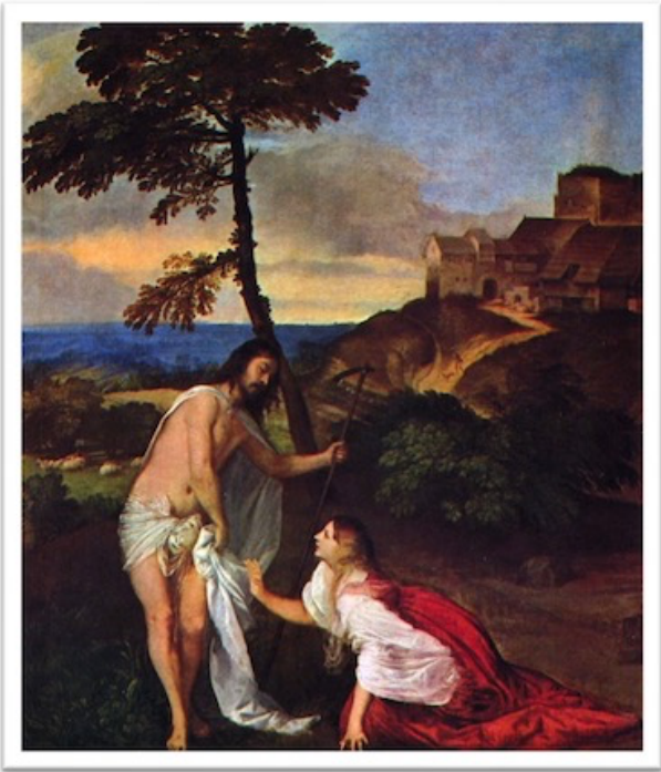
Ticiāna glezna Noli me tangere (Nepieskaries man)

Augšāmcēlies Kristus un Marija Magdalēna