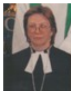
Bīskape emerita Jāna Jēruma- Grīnberga