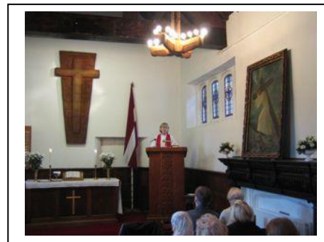
Rowfant House, Wallage Lane RH10 4NG